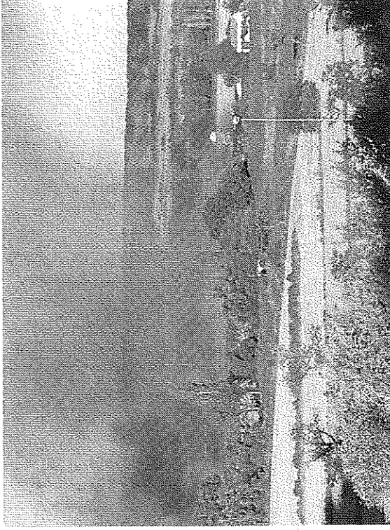
La gran columna de humo que generó el incendio.

HUESCA. Los bomberos de Huesca intervinieron ayer cerca del casco urbano para sofocar un incendio que se declaró en unos rastros situados en las cercanías de la ermita de Salas. El fuego se inició a última hora de la tarde y el viento que soplabla hizo que se extendiera con gran rapidez. Los efectivos desplazados controlaron pronto su avance, aunque permanecieron en el lugar varias horas hasta que se extinguió totalmente. La situación generó gran expectación entre los vecinos debido a su proximidad al núcleo urbano.