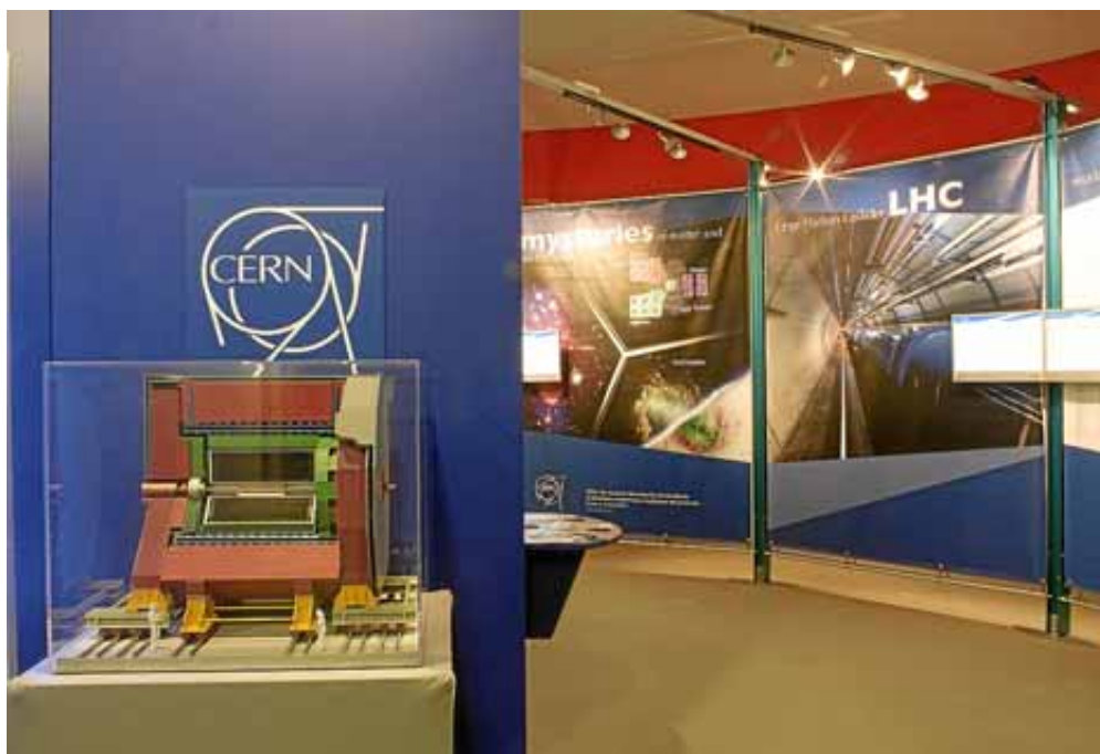
En primer término, maqueta del detector Atlas del CERN.